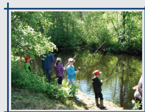
Fête de la pêche