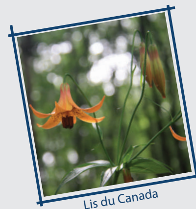
Lis du Canada